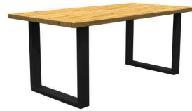
U-Profil oben 100 , unten 50 mm