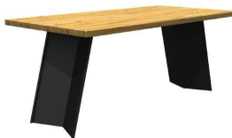
Metallprofil 100x100 mm