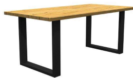
U-Profil oben 100 , unten 50 mm